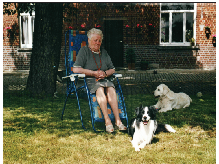
Rustig genietend in haar tuin met de 2 honden.